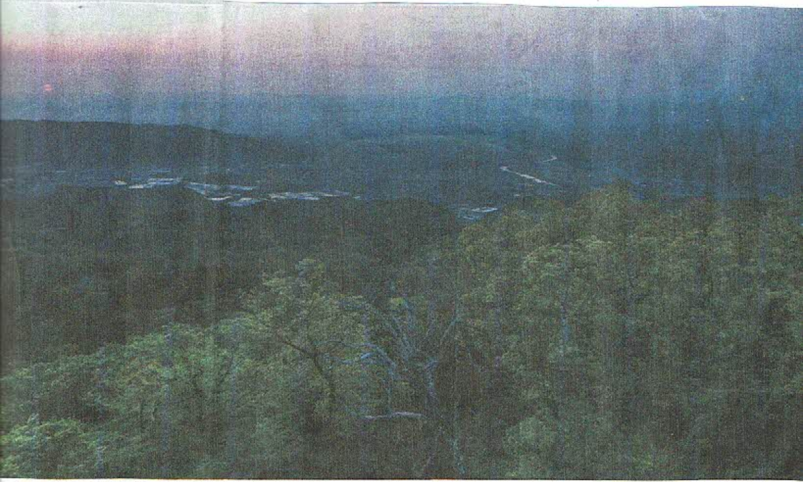
城があったとされる信貴山山頂から 奈良盆地を望む。朝焼けが空を彩る (奈良県平群町で、小型無人機から)