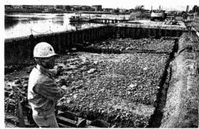
「朝酌渡」の推定地で見つかった石敷き護岸の遺構(2020年撮影、松江市)

た道路跡が見つかった。出雲国風土記に「正西道」と記された古代の山陰道跡と考えられ、18年と21年に国の史跡に指定された。茨城県日立市では、古代官道跡と道に隣接した建物群が確認された。古代官道には馬を置く「駅家」が一定間隔で整備された。建物跡は常陸国風土記に記された「藻嶋駅家」の可能性が高く、18年「長者山官衙遺跡及び常陸国海遺跡」として国の史跡に指定された。