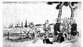
海岸の茶店からペリー艦隊を見物する人々(「黒船来航風俗絵巻」より。埼玉県立歴史と民俗の博物館所蔵)

当時の軍艦の実像もあまり知られていない。蒸気船といっても、通常は石炭節約のため帆走で、蒸気機関は逆風時や接岸時などに限